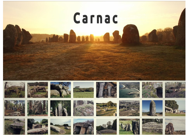
Vidéo : « Carnac les rives du Morbihan au Néolithique, lieu de toutes les démesures » Durée : 3:32