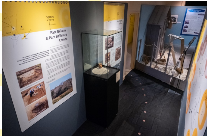
Mentions obligatoires : « Sorti(s) de Terre » Musée de Préhistoire de Carnac. Cl A. Polkowski