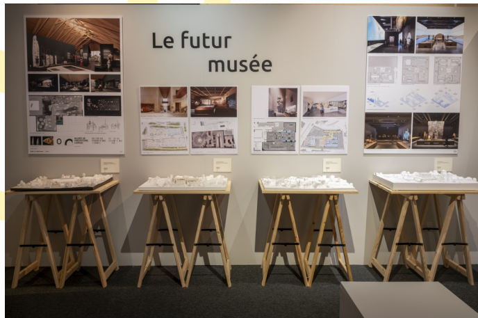
Mentions obligatoires : « Sorti(s) de Terre » Musée de Préhistoire de Carnac. Cl A. Polkowski